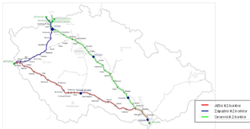
Obrázek 2: Plánované vodíkové koridory v ČR do roku 2035

NET4GAS rovněž plánuje upravit jeden plynovod severní větve mezi hraničními body Lanžhot a Brandov. Repurposing tohoto koridoru bude pravděpodobně dokončen mezi roky 2030-2035, v závislosti na rozvoji poptávky. Díky tomu bude ČR napojena na tři z pěti plánovaných evropských importních vodíkových koridorů, budou mít čeští spotřebitelé přístup k cenově dostupnému vodíku 44 . Každý z importních hraničních bodů bude mít počáteční (tj. od roku 2030) kapacitu přibližně 1.5 mil. t vodíku za rok (cca 50 TWh/rok). Tato kapacita je více než dostatečná pro pokrytí očekávané spotřeby v ČR a lze ji v případě potřeby v dalších letech relativně jednoduše dále navýšovat.